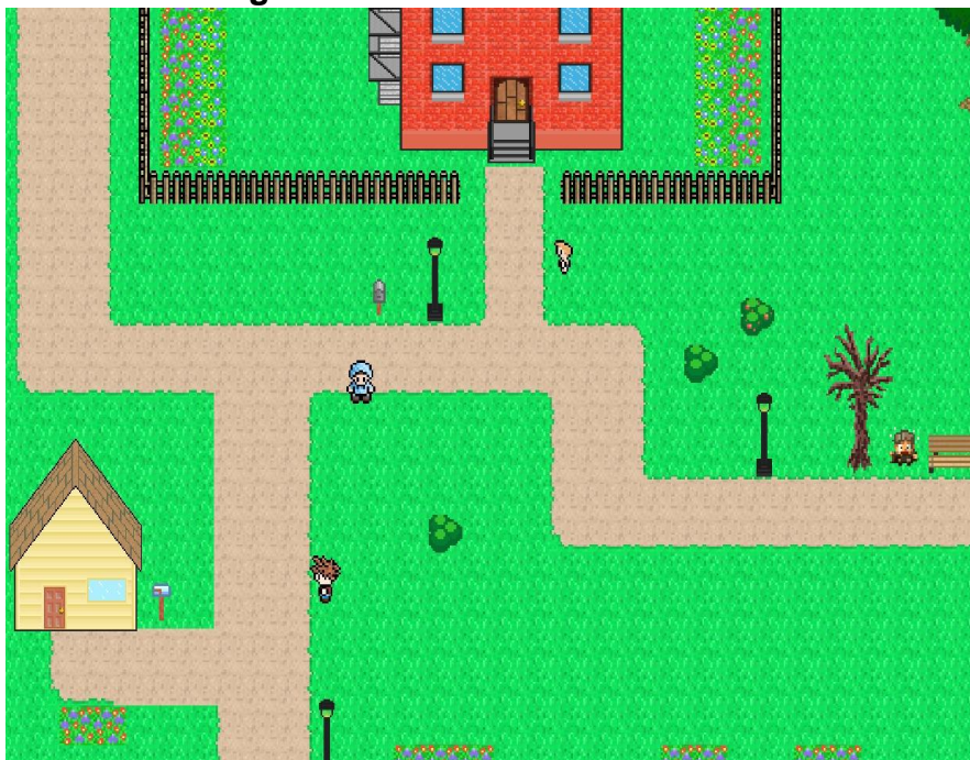
Figura 3 –O Recruta

Para construir os jogos foram obtidos os modelos de processo de negócio em BPMN necessários para dar entrada no método PYP (modelados a partir do portal de serviços do governo federal). A partir disso, foram executadas todas as etapas do