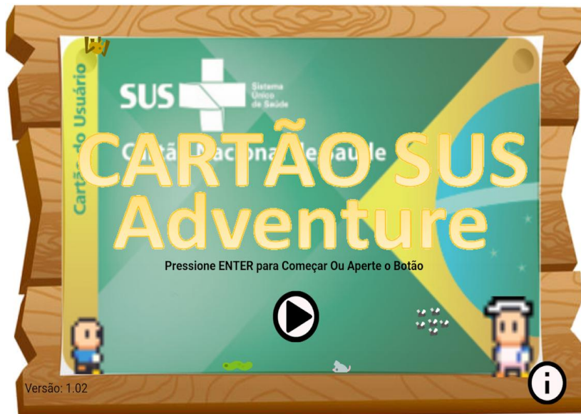
Figura 2 – Cartão SUS Adventure